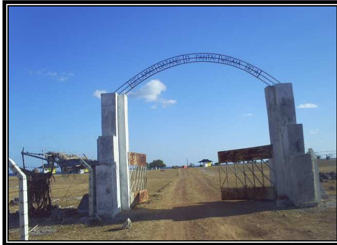
Pintu Gerbang Menuju Pantai Wisata Bo'a (15 Juni 2008) (Lokasi Penghadangan dan Pertempuran 14 Mei 1960)

Perlawanan Masyarakat Desa Bo'a Terhadap Negara di Nusak Delha, Pulau Rote, Nusa Tenggara Timur