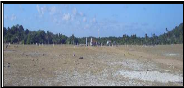
Gambar 3. Lokasi Penghadangan dan Pertempuran Bo'a 1960. Ditempat ini-lah 2 polisi dan 2 warga sipil tewas dalam pertempuran Bo'a 1960.

Tim penagih pajak yang melarikan diri tiba di Desa Nemberala keesokan harinya (tanggal 15 Mei 1960) pada jam 16.00 Wita. 1 jam kemudian tiba-tiba muncul Petrus Ngongobili dalam keadaan luka parah di kepala. Ia membawa berita bahwa 2 temannya telah meninggal dunia. Kondisi Petrus Ngongobili 27 sangat lemah karena dikejar oleh kira-kira 10 orang warga Desa Bo'a ditambah lagi harus berlari sejauh \pm 10 \text{ Km}^2 (jarak Desa Bo'a dan Desa Nemberala).