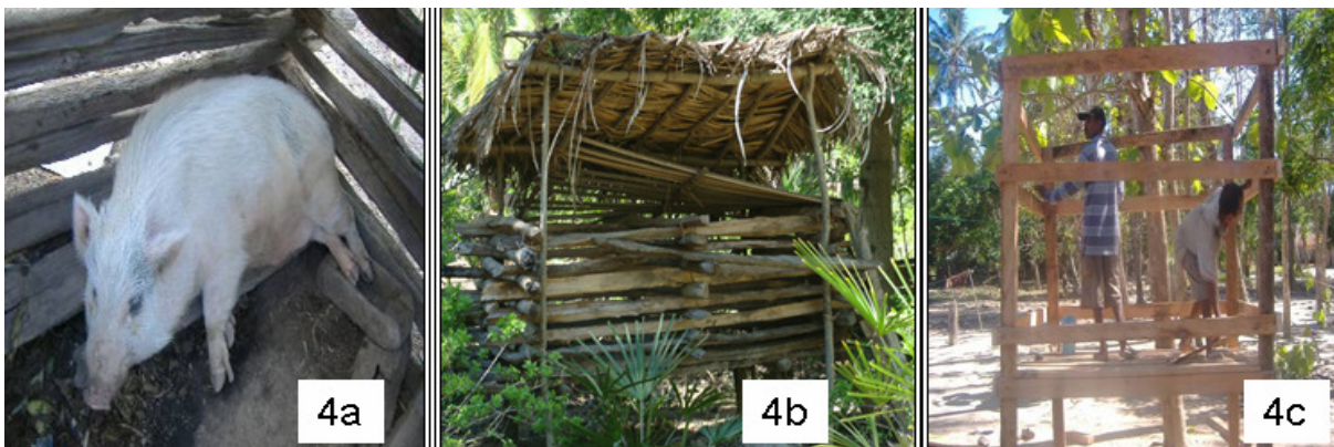
Gambar 4a. Kandang babi status quo, yang rentan banjir. Ketika banjir terjadi, pemilik sibuk menyelamatkan diri dan babi akan mati. Gambar 4b. Inovasi Bapak Manu, elevasi dasar kandang aman terhadap genangan akibat luapan banjir yang masuk ke halamannya. Gambar 4c. Merupakan replikasi pembuatan kandang “Manu Model” oleh PMPB yang dipejari dari Toineke dan disebarikan ke daerah-daerah banjir di Timor Barat. Gambar 4a, 4c © PMPB Kupang, Gambar 4b. © Jonatan Lassa.

Relevansi praktek keluarga Manu di Timor dalam “hidup bersama banjir” bisa ditemukan secara komunal pada masyarakat Besikama, di Kabupaten Belu, yang sudah sangat lama “hidup bersama banjir”. Masyarakat tradisional Besikama sebenarnya sudah mengenal tentang praktek mitigasi banjir berdasarkan konstruksi rumah tradisional mereka sejak abad yang lalu, yakni rumah panggung, yang sudah mengalami disorientasi karena persepsi ‘modern’ dalam sosok rumah tembok. Praktek rumah panggung di Timor Barat secara genuine hanya bisa ditemukan di Besikama, yang hakekatnya adalah daerah hilir dan rentan banjir dan yang pasti adalah kehadiran rumah panggung di Besikama bukan karena alasan perang dan hewan liar berbahaya sebagaimana di Sumba.