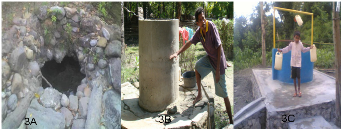
Gambar 3A. Sumur milik masyarakat di Besikama yang rentan dan sering terkena banjir karena rentan pada sedimentasi dan tertutup sedimen ©PMPB Kupang. Gambar 3B. Sumur air minum di desa Toineke ditinggikan karena naiknya permukaan air banjir dari tiap tahun ke tahun dari Sungai Noemuke. ©Jonatan Lassa. Gambar 3C. Model sumur yang lebih aman dari muka air banjir maksimum di Besikama yang menjadi prototipe PMPB Kupang. ©PMPB Kupang.