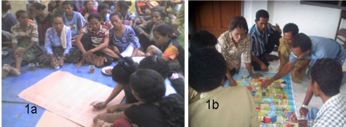
Gambar 1a. dan 1b. Penguatan kapasitas masyarakat secara partisipatif di Besikama, Belu © Foto PMPB Kupang.

dasar yang dianggap relevan. (Lihat Gambar 1a dan 1b)